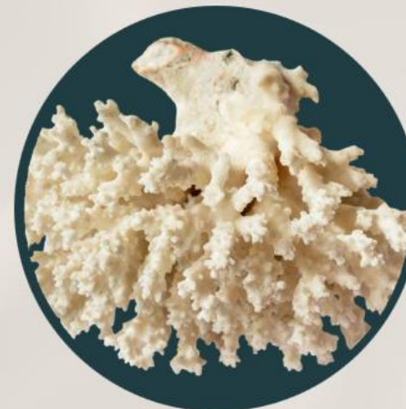
サンゴライト® (炭酸Ca、炭酸Mg、クエン酸、 硫酸Mg)：整肌成分