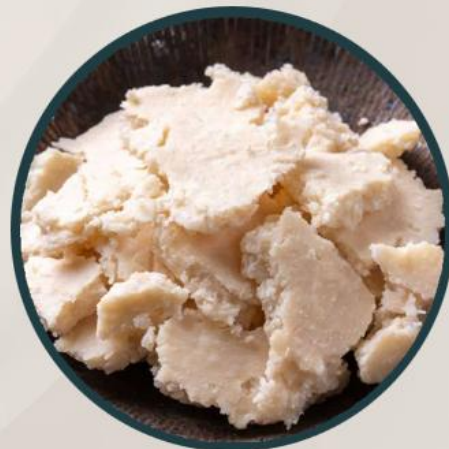
酒粕エキス (永井酒造) ：整肌成分