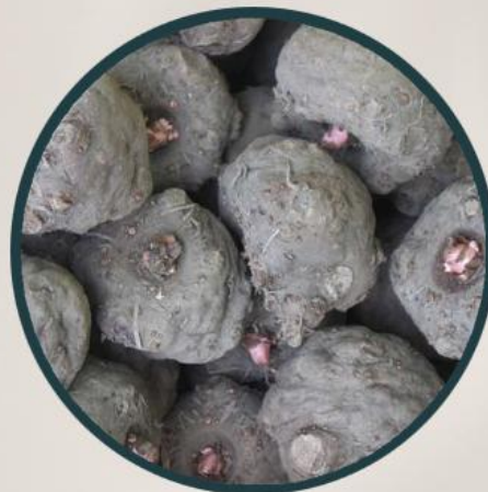
こんにゃくセラミド (雪国アグリ) ：保湿成分