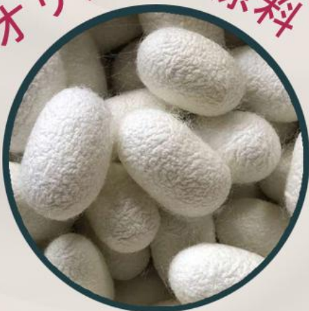
シルクエキス ：保湿成分