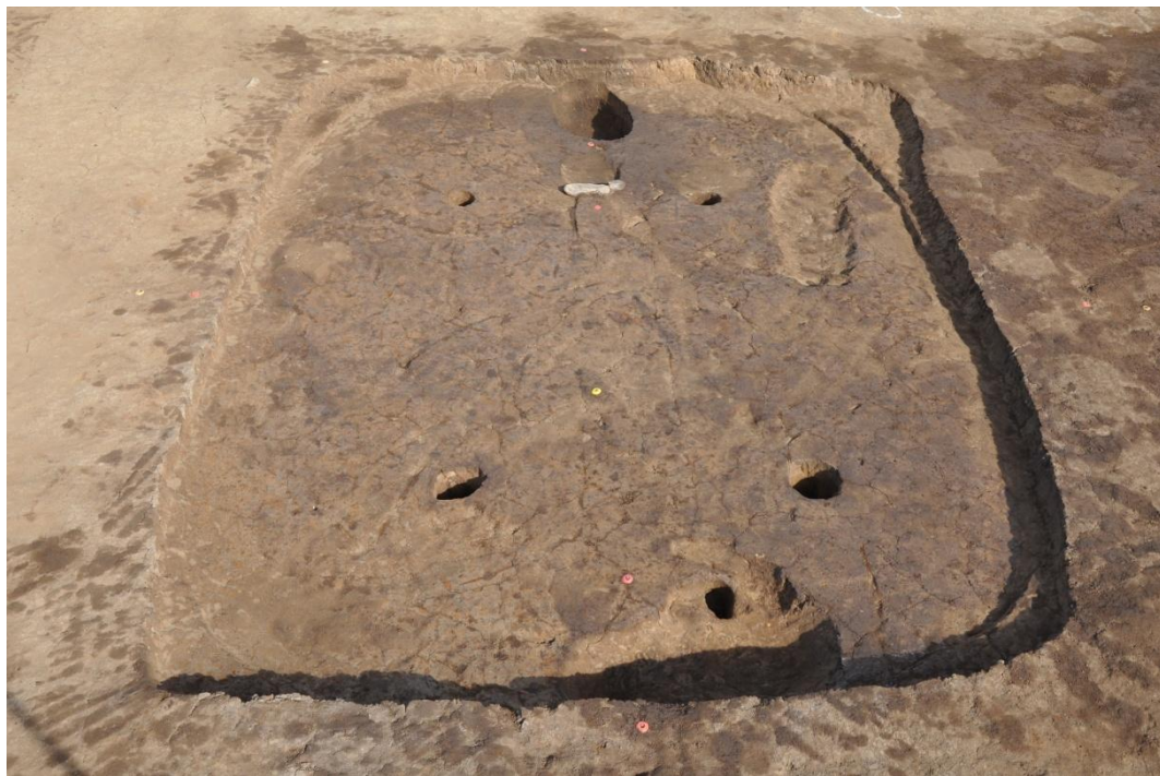
弥生時代の竪穴建物跡