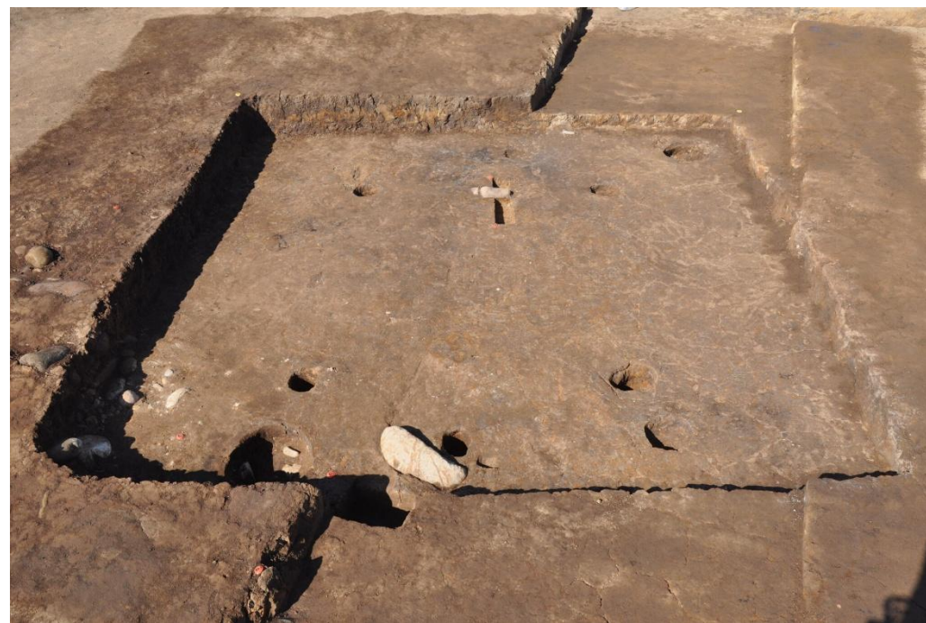
古墳時代の竪穴建物跡