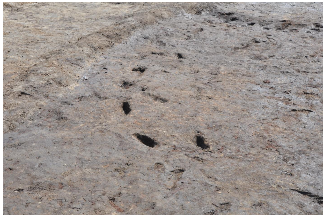
古代の水田跡で確認した人の足跡