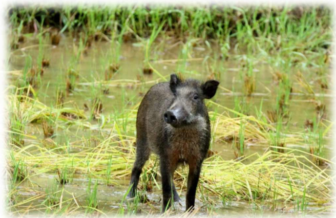
イノシシ(田んぼの踏み荒らし)