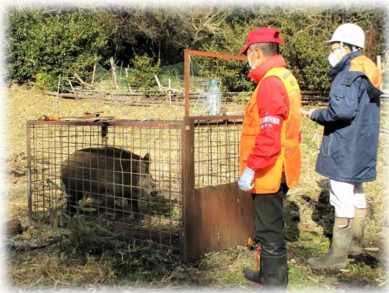
イノシシ(箱わな)と捕獲隊員

全国的には、猟友会を中心とした狩猟者の減少により、市街地や農地へ出没する鳥獣が増えています。一方、本市における有害鳥獣捕獲頭数が 3 年連続で過去最多となった要因については多数考えられますが、一つに、市有害鳥獣捕獲隊を中心とした捕獲体制の確立により、有害鳥獣の適切な個体管理ができていると考えています。