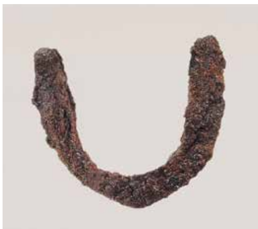
U字形鉄刃(人見東向原遺跡出土)

「U字形鉄刃」を鍬や鋤につけたことで、木製では刃が立たなかった硬い地面も、現代と同じように耕せるようになりました。木製から鉄製の農具に変わり、米作りも飛躍的にはかどったことでしょう。