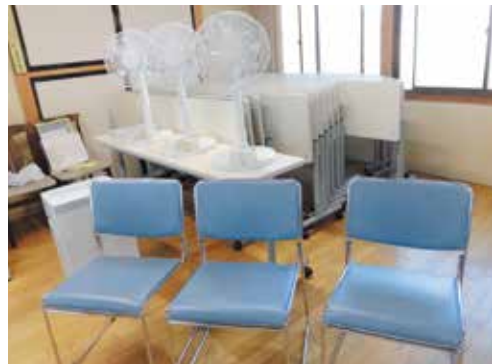
▲安中市磯部地区第1区では、この宝くじの助成金によりテーブルほかコミュニティ活動用品を整備しました。

この事業は、宝くじの普及広報を行うこと、コミュニティの健全な発展を図ることを目的に、自治会などへ助成を行っているものです。