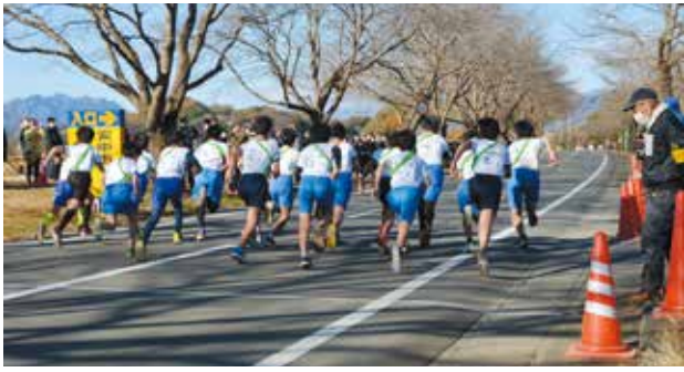
▲2年ぶりの開催となった小学生駅伝競走大会が、12月4日に行われました