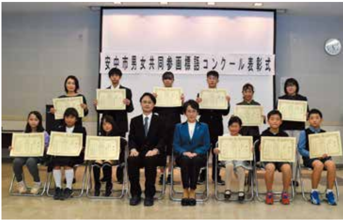
▲第3回男女共同参画標語コンクール受賞者の皆さん

審査の結果、次のとおり入選作品が決定し、表彰式では受賞者の皆さんに賞状と副賞が授与されました。受賞された皆さん、おめでとうございます。入選作品は、今後の男女共同参画の啓発活動などに幅広く活用します。