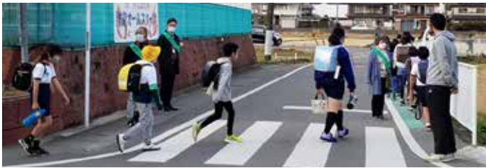
▼児童下校時補導活動の様子

主な活動は、①児童下校時補導活動、②夜間街頭補導活動、③駅前街頭補導活動です。下の表は令和3年4月～12月の活動回数と参加人数を示したものです。