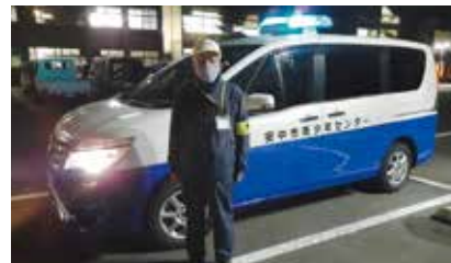
▲夜間街頭補導活動の様子