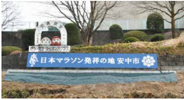
▲国道18号線から見える文化センターの斜面の部分に「日本マラソン発祥の地 安中市」の看板を設置しました