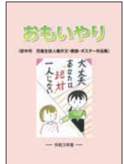
▲人権作品集「おもいやり」

各学校での人権教育の成果により、子どもの持つ鋭い感性と人権感覚豊かな優れた代表作品集となっています。作品集をご覧いただき、子どもたちのみずみずしい感覚をもとに、改めて人権について考えてみましょう。「おもいやり」は市内小中学生がいる全家庭に配付するとともに、各地区公民館・生涯学習センターなどで配布(無料)しています。