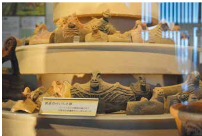
獣面土器(ふるさと学習館常設展示室)