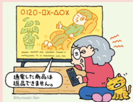
(本文イラスト：黒崎 玄)

テレビショッピングで「1週間以内返品可能」と言っていたマッサーチェアを購入した。うまく使えないため返品を申し出たが「通電した商品は返品できない。テレビ画面でも表示している」と言われた。番組を録画していたので確認したところ、最後に小さな文字で表示されていたが、気づかなかった。使用しないと使い心地はわからない。返品したい。