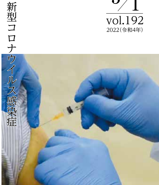
新型コロナウイルス感染症