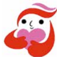
犯罪被害者等支援 シンボルマーク 「ギョットちゃん」