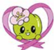
安中市 マスコットキャラクター こうめちゃん