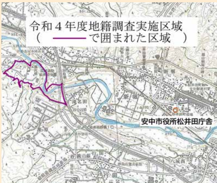
令和4年度地籍調査実施区域 ( ——— で囲まれた区域 )

実施区域およびその隣接の土地所有者の皆さんには、後に説明会開催の通知をしますので、事業の推進に協力をお願いします。