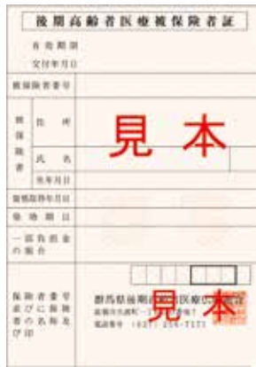
▲2回目は「だいたい色」です