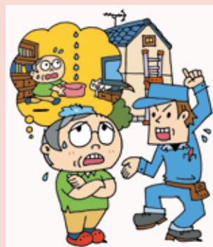
(本文イラスト：黒崎 玄)

「近所で工事をしているのであいさつに来た」と訪ねてきた男性から、「お宅の屋根の鬼瓦が傾いているのが気になってきた。隣の家に落ちると大変だ。今なら残っている漆くいを使って1,000円で直してあげる」と言われ、1,000円ですぐ直してもらえらるなら、と修理をお願いした。作業終了後「瓦が浮いている。このままだと雨漏りするので屋根全体を工事したほうがいい」と言われ、雨漏りしたら大変だと慌ててしまい、約20万円の工事の契約をした。しかし、冷静になってみると契約を急ぎすぎたような気がする。クーリング・オフしたい。