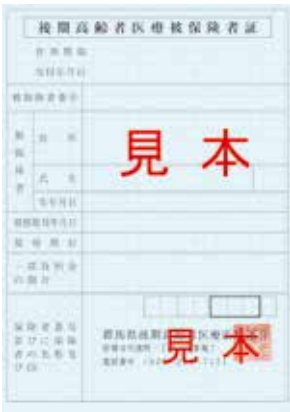
▲1回目は「みず色」です