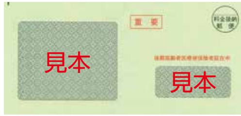
▲1回目は、7月中旬ごろに「うすいみどり色」の封筒で郵送します