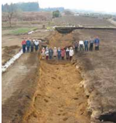
人見西向原遺跡の大溝

碓氷地域に牧が設置されたのは、牧の条件に適した広大な土地を確保できただけでなく、この地域を勢力に置いた人物が、牧を設置できるほどの力を持ち、中央国家と関係をもっていたことが背景にあったと考えられます(以下次号)。