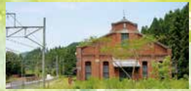
明治44年建造の旧丸山変電所は国の重要文化財