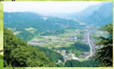
旧中山道途中、剷石山 (剷) からの坂本宿