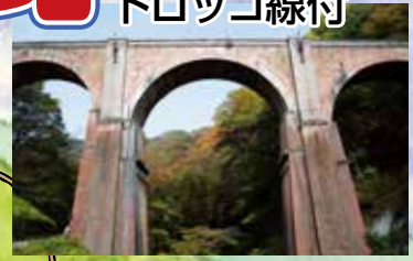
めがね橋 (国の重要文化財) 左手に6号・碓氷第3橋梁・右手に5号トンネル