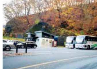
めがね橋無料駐車場

芸術的で多くの人を魅了する、200万8000個のレンガで造られている日本最大の4連アーチ式鉄道橋。長さは91m、高さ31m。明治25年に完成した碓氷線のシンボル。駐車場、トイレは、橋を下り遊歩道を300m行くとあります。