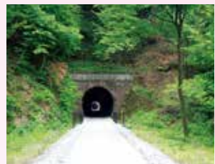
手前9号、その奥に8号トンネル

熊ノ平は信越本線が通わなくなり、今はアプトの道の折返しポイントとして生まれ変わりました。当初単線であった期間、横川～軽井沢間で唯一の平坦地であった熊ノ平駅では、上下線の列車が待ち合わせすれ違いをしていました。この頃の熊ノ平駅は、行楽の季節、乗降客で賑わっていました。そして信越本線が複線化すると、熊ノ平駅は、変電所の機能を残して、駅としての機能は必要とされなくなりました。