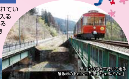
アプトの道と平行して走る碓氷峠のトロッコ列車「アブルバくん」

鉄道の歴史と列車が一同に集められているテーマパーク。入口のゲートを入ると、小さな子供から大人まで楽しめるSL「あぶとくん」が人気の的。本物の機関車を運転体験できるコースやズラリ展示された歴史的名車には、見て、触れることもできます。