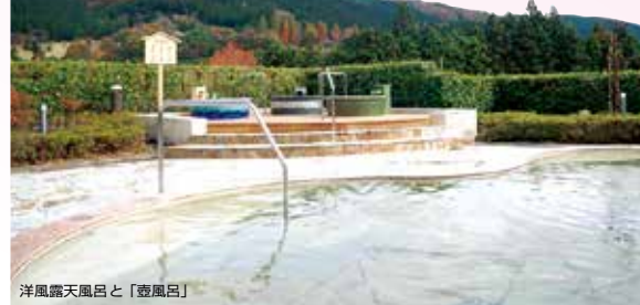
洋風露天風呂と「壺風呂」

お風呂は2階に和風・洋風大浴場(サウナ付)、露天風呂2カ所。風呂付休憩個室(要予約)も2室あります。アプトの道から直結した1階は入館無料。レストラン、売店、ロビー等をご利用いただけます。周辺観光の起点としても、ご活用ください。