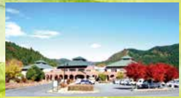
峠の湯は、アプトの道方面にも入館口有