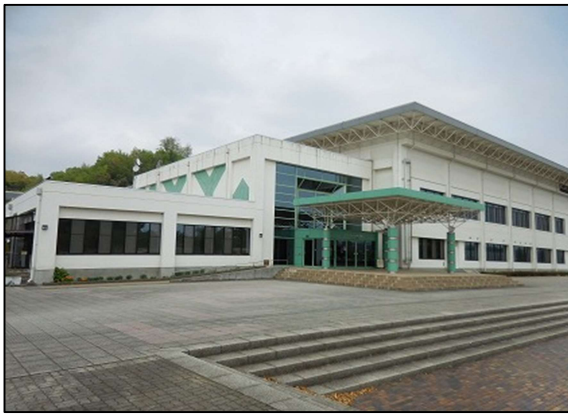
安中市スポーツセンター

市は、施設の維持管理経費などの新たな財源を確保するとともに、民間企業が地域社会に貢献できる機会の提供を図るため、ネーミングライツを導入します。