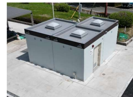
トイレ(多目的トイレ有)