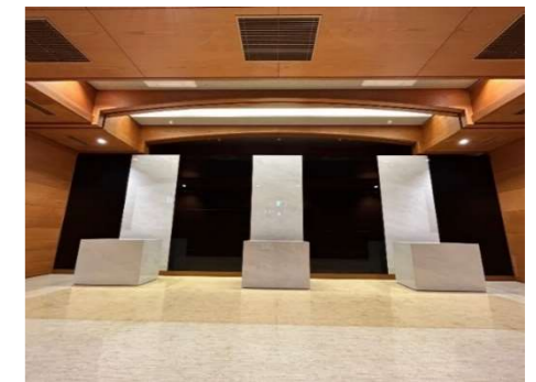
日常の参拝を行うための礼拝ホール。香炉を備えつけており、線香をあげることができます