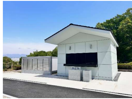
合葬墓の前面には線香台と献花台を設けており、日時間問わず参拝することができます