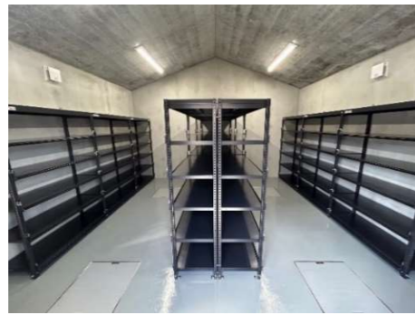
合葬墓の内部の様子 まずは骨壺のまま納め、棚が埋まったら随時地下スペースに移動します