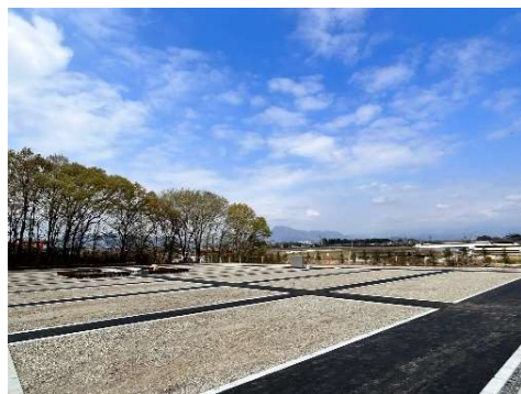
妙義山や浅間山が望める、自然豊かな明るい区画墓地となっています