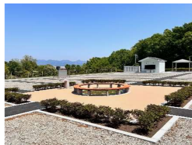
区画墓地の中央には休憩所を設けており、ベンチに座って休憩することができます