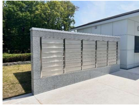
御影石の記名板を設置するための墓誌です