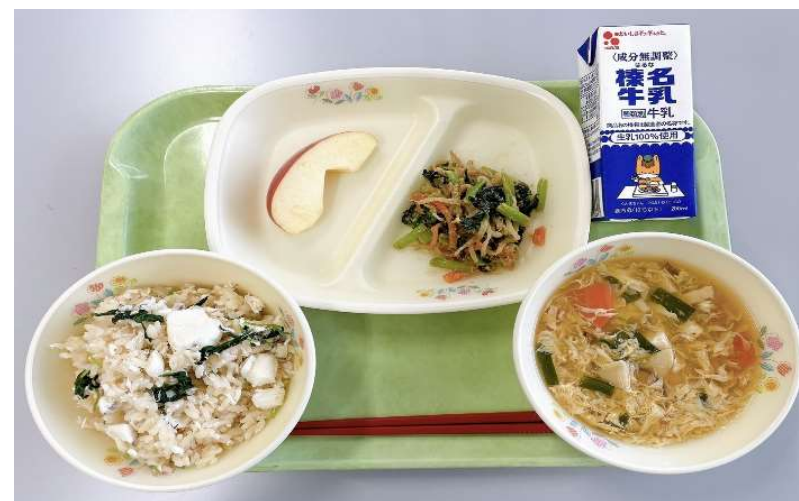
2022.10.6 給食センター献立 鯛めし・小松菜のごま和え・かきたま汁・りんご・牛乳