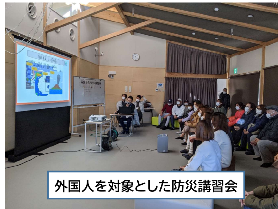
外国人を対象とした防災講習会