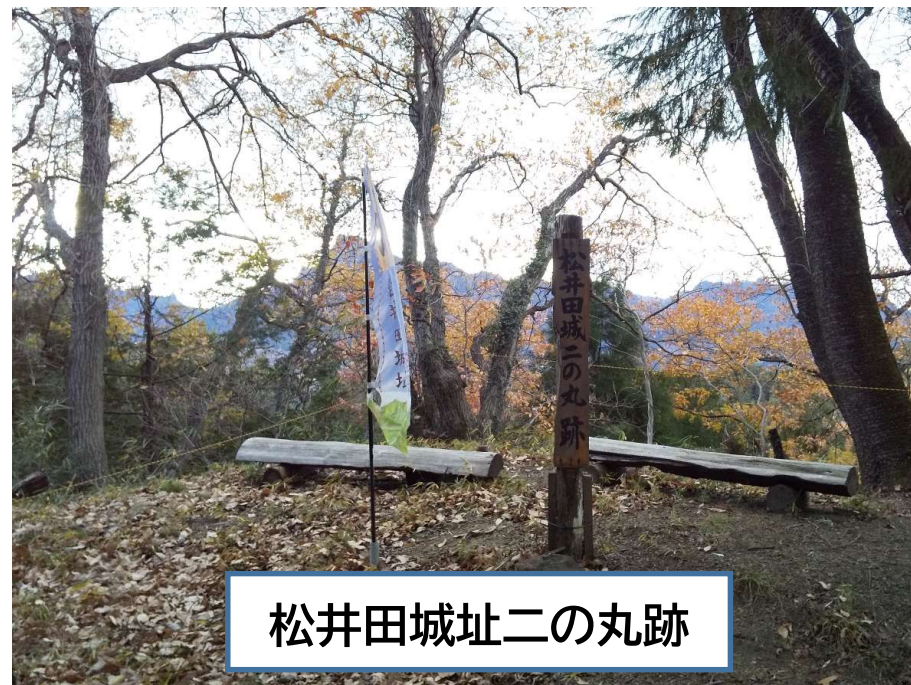
松井田城址二の丸跡