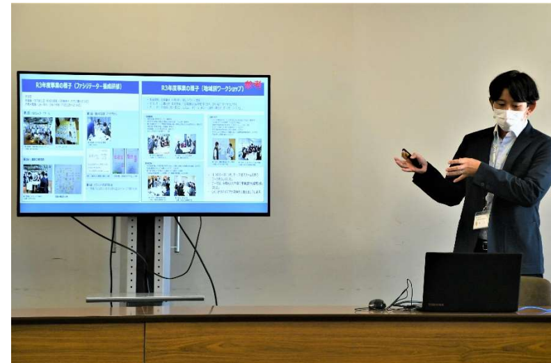
独自の提案を行う若手メンバー