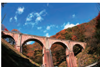
国重要文化財 「めがね橋（碓氷第三橋梁）」