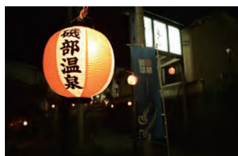
温泉記号発祥の地 「磯部温泉」