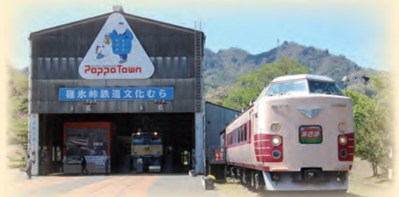
鉄道テーマパーク「碓氷峠鉄道文化むら」

「安中市まち・ひと・しごと創生推進計画」について、企業の皆さまからの寄附を募集しています。ぜひ、安中市の地方創生を応援してください。