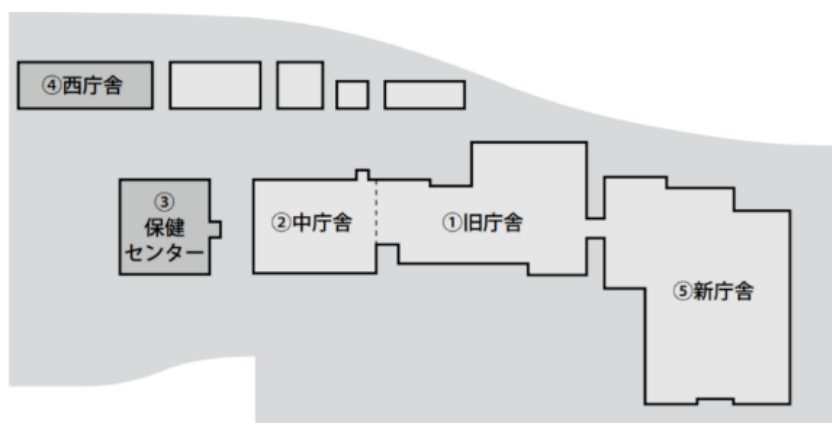
【安中市役所本庁舎図】