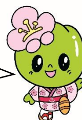
市のマスコット 「こうめちゃん」