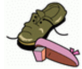
リサイクルできない衣類・布類、

リサイクルできる古着・古布は、有価物集団回収(廃品回収)または古紙行政回収(ごみステーション回収)に出してください。