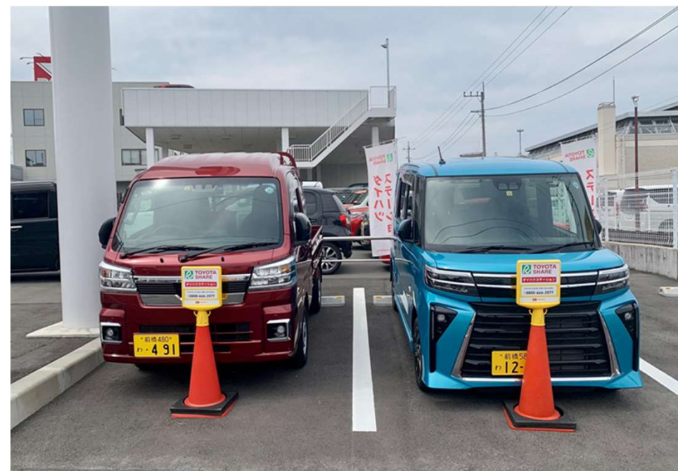
カーシェアリング ダイハツステーション イメージ (参考:群馬ダイハツ自動車(株)前橋西店)