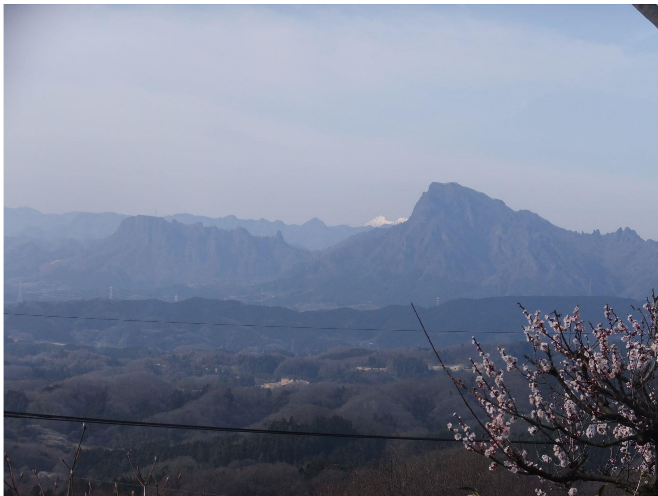
🌿 みのりが丘（撮影場所・撮影時期：秋間みのりが丘、令和2年4月）