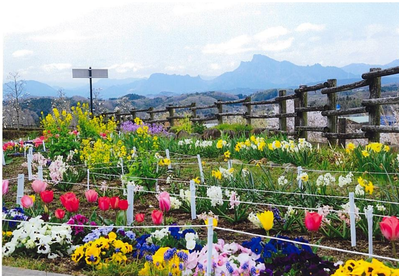
🌱花と妙義山（撮影場所・撮影時期：五料、2018年3月）