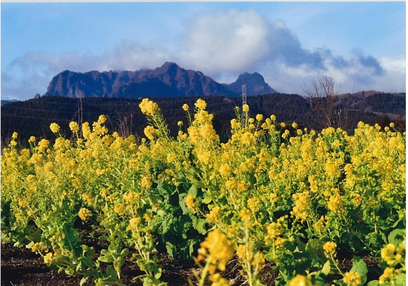
春雪（撮影場所・撮影時期：人見、2019年12月）