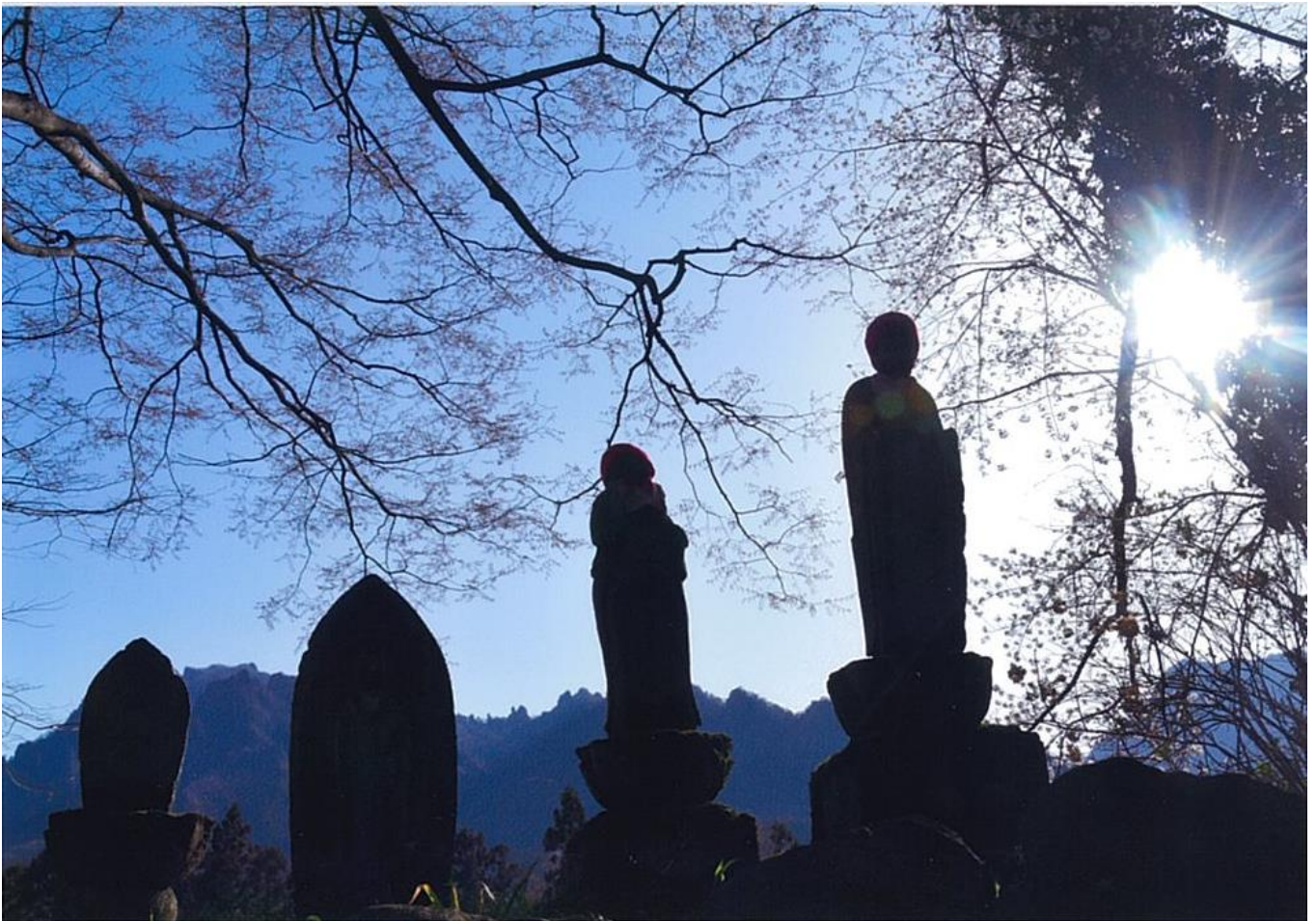
夕照（撮影場所・撮影時期：古屋、2019年12月）