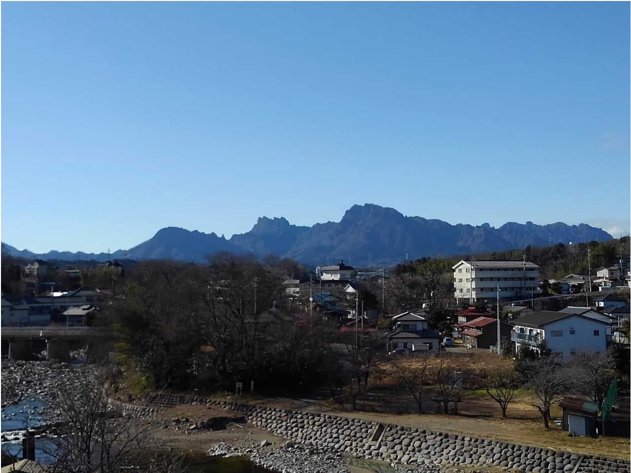
見晴らし台からの丁須の頭（撮影時期・撮影場所：相馬岳コースの見晴らし台、2017年10月）