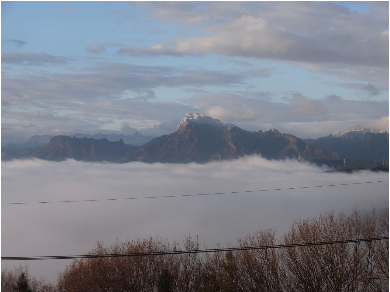
雪の妙義（撮影場所・撮影時期：東上秋間長岩、冬～早春）