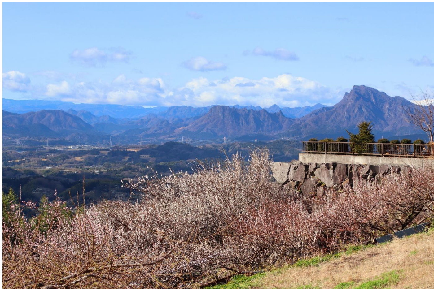
みのりが丘から（撮影場所・撮影時期：安中榛名駅前48号線沿い、2015年9月）