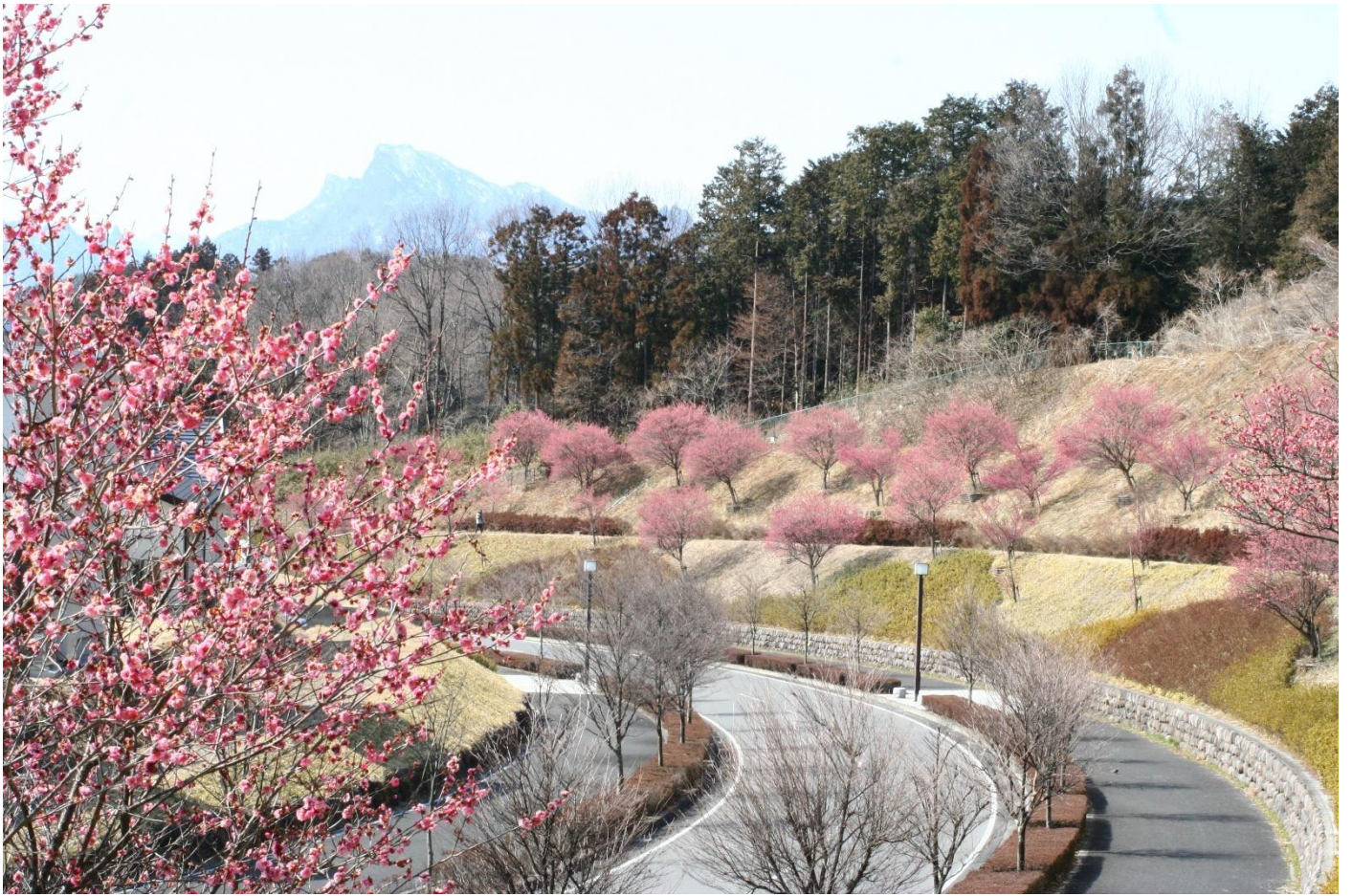
磯部駅より（撮影場所・撮影時期：磯部駅、2015 年 9 月）