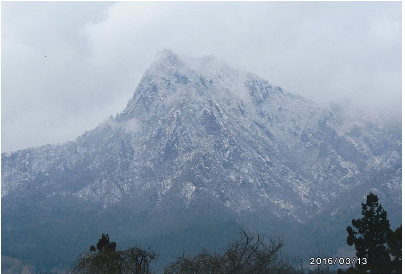
春雪の妙義山⑤（撮影場所・撮影時期：西松井田駅周辺、2016年3月）