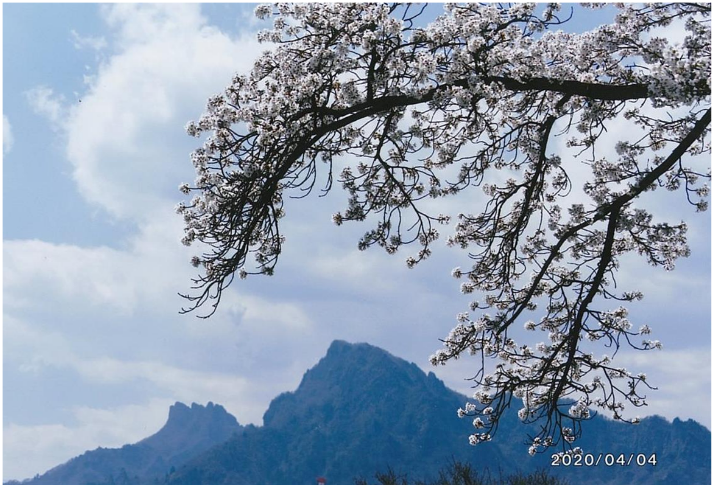
思い出の場所③（撮影場所・撮影時期：松井田小学校校庭、2020年4月）