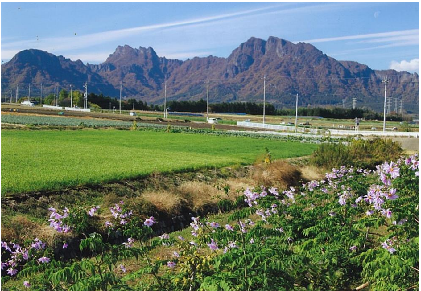
初夏の頃（撮影場所：松井田町・越泉）