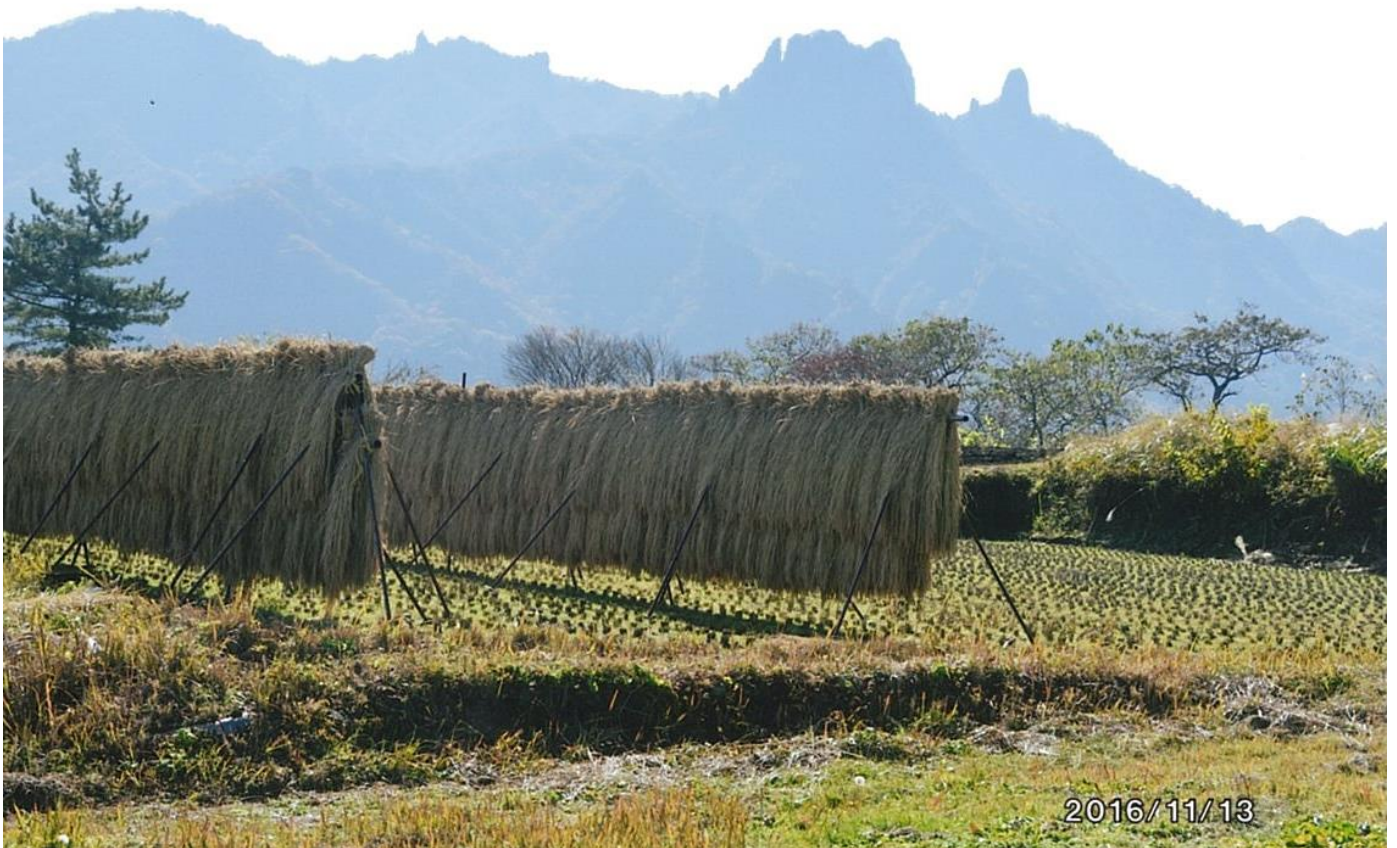
収穫の頃②（撮影場所・撮影時期：旧坂本小学校の裏奥、2016年11月）