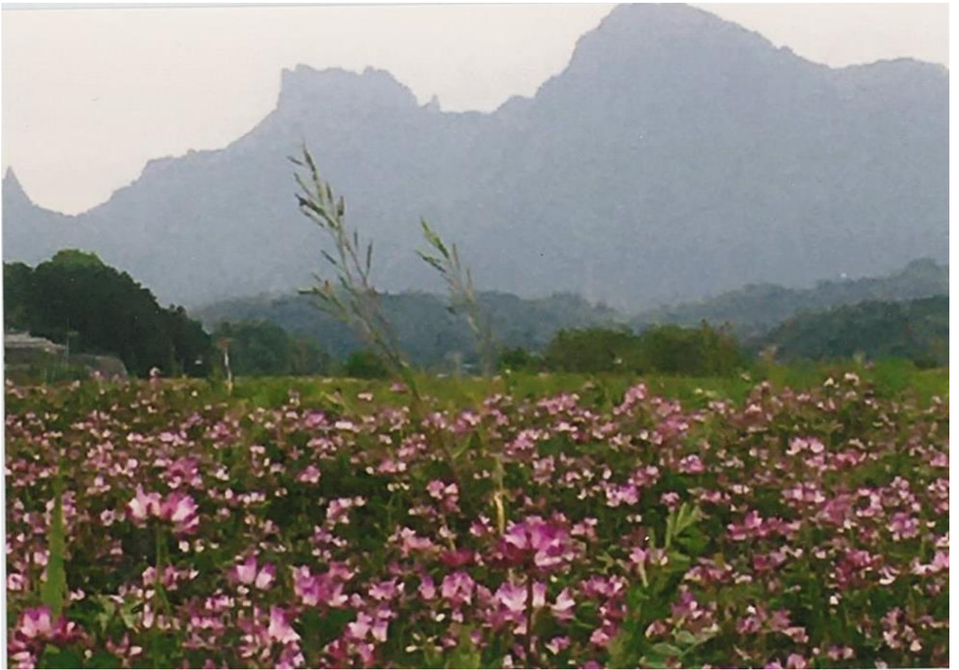
思い出の場所①（撮影場所・撮影時期：松井田小学校校庭、2020年4月）