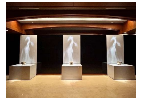
日常の参拝を行うための礼拝ホール。香炉を備えつけており、線香をあげることができます