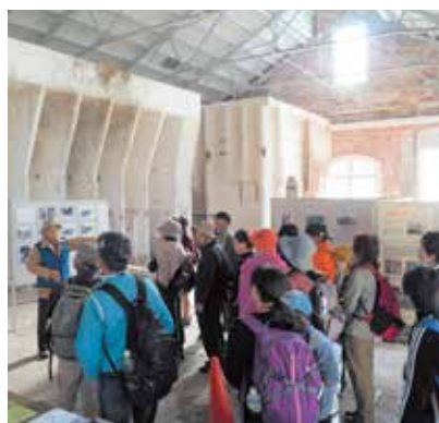
令和元年度の様子