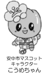
安中市マスコット キャラクター こづめちゃん