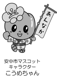
安中市マスコットキャラクター こうめちゃん

【調査対象者】無作為抽出した16歳以上の市民4,000人 【回答期限】2月28日（月） 【問合せ】困 秘書政策課政策推進室（☎内線1015）