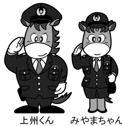
上州くん みやまちゃん