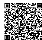
いのち・つなぐサポートサイト