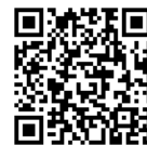
よりそいホットライン