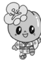
安中市マスコット キャラクター ころめちゃん