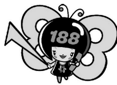
消費者庁消費者ホットライン 188イメージキャラクター イヤヤン

そんなときは一人で悩まずに、全国どこからでも3桁の電話番号でつながる消費者ホットライン「188(いやや)」にご相談ください。専門の相談員がトラブル解決を支援します。