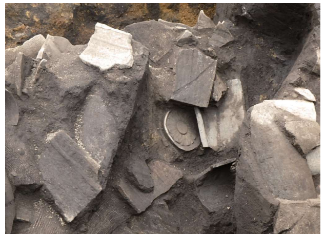
町北遺跡出土の古瓦