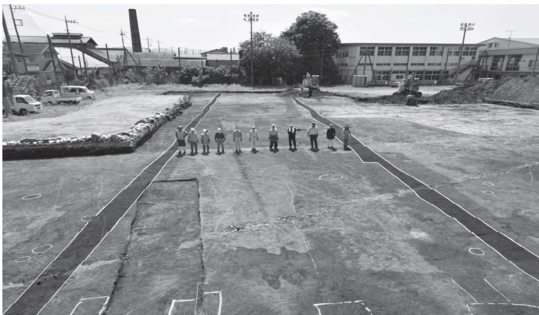
推定東山道全景写真（東から西へ向けて撮影）