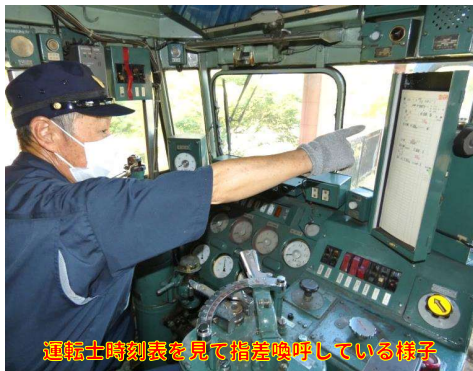
運転士時刻表を見て指差喚呼している様子