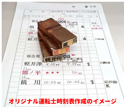
オリジナル運転士時刻表作成のイメージ