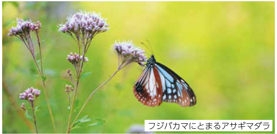
フジバカマにとまるアサギマダラ