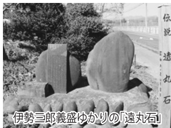
伊勢三郎義盛ゆかりの「遠丸石」