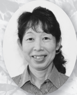
安中地域自殺予防対策 連絡会議委員