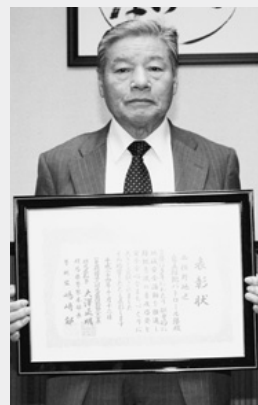
西横野地区 自主防犯パトロール隊