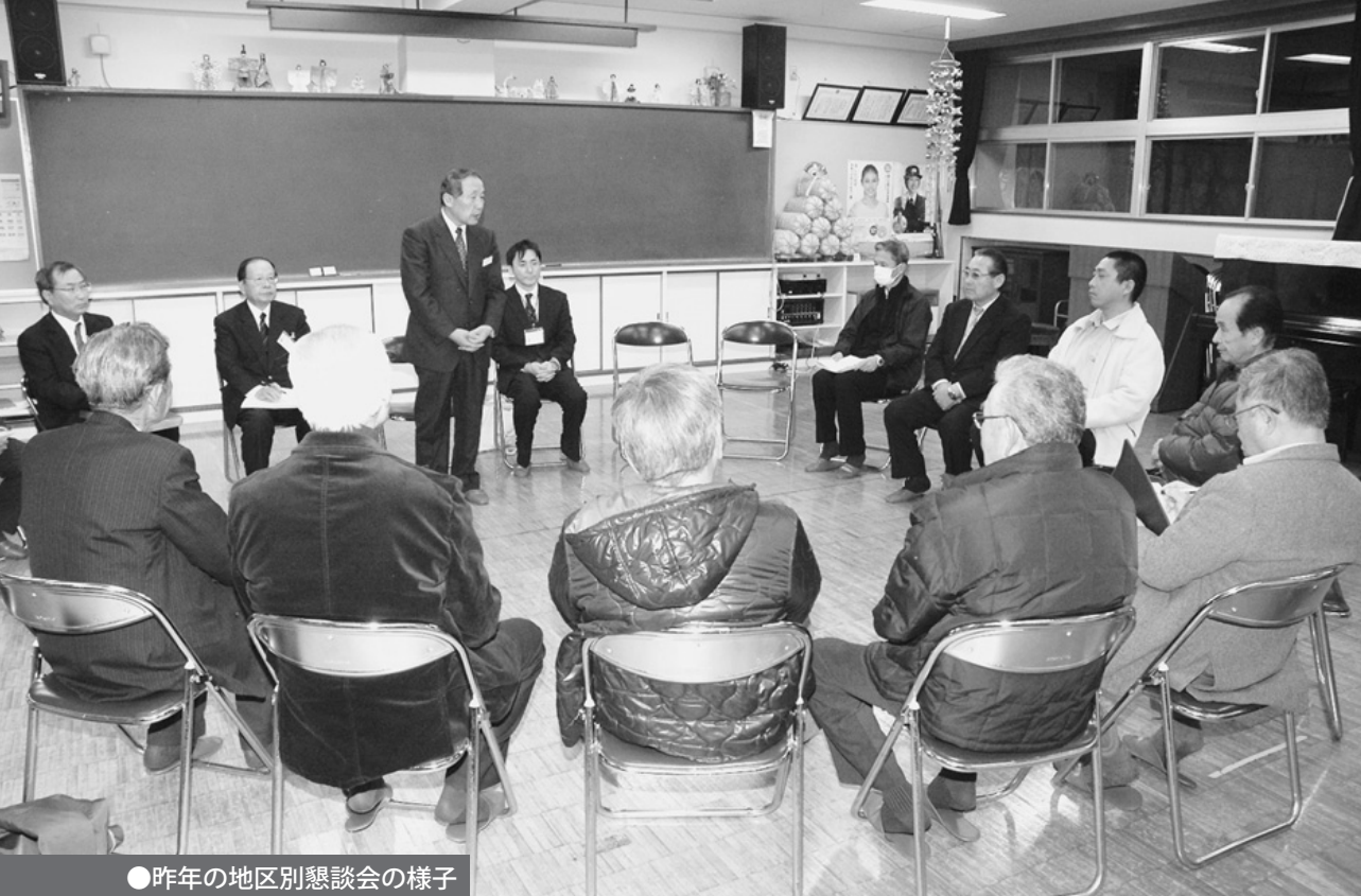
●昨年の地区別懇談会の様子