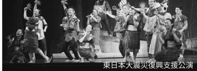
東日本大震災復興支援公演

遠野市と秋田のわらび劇場で好評だった舞台が早くも全国ツアー決定。その初日の公演が安中市文化センターにて行われます。東北に生きるわらび座が、東北に息づく歌と踊りと物語を土台にした勇気とエネルギーにあふれる舞踊舞台を、どこよりも早くお届けします。