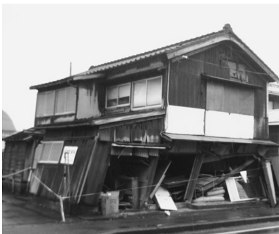
▲新潟県中越沖地震で倒壊した木造住宅