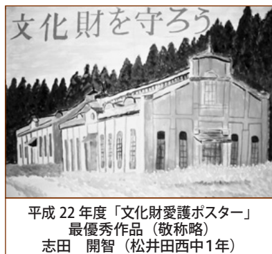
平成 22 年度「文化財愛護ポスター」 最優秀作品(敬称略) 志田 開智(松井田西中1年)

シメ縄作り お松迎えが済むとしめ縄作りをする。材料の稲藁は、稲刈りの時に青いままのものを取っておき、陰