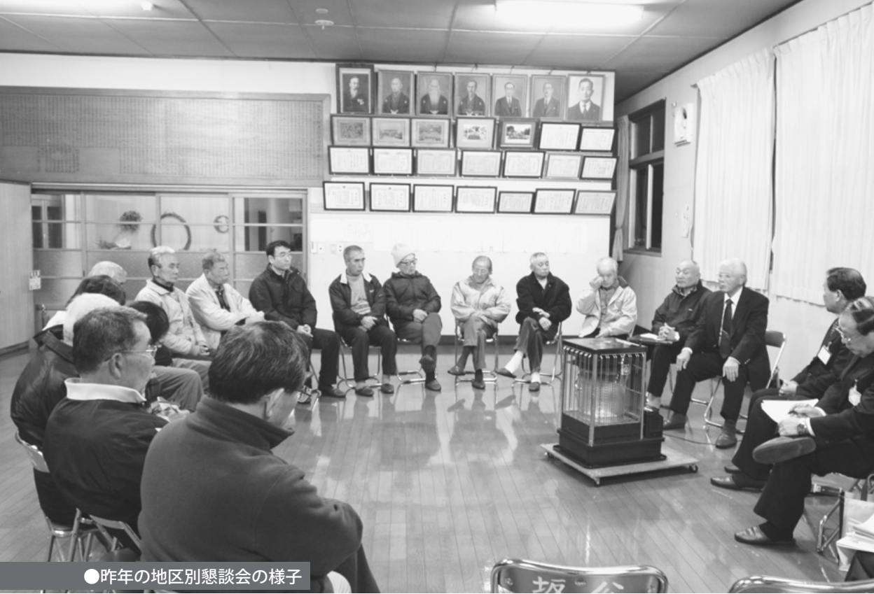
●昨年の地区別懇談会の様子