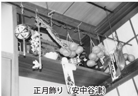
正月飾り(安中谷津)

お棚づくり 正月様のお棚は、30日の餅つきのあとでする。神棚の前に青竹を吊し、昆布(喜ぶ)や羽根・まり(家運がはね上がる)、栗(繰り回しが良くなる)やフキノトウ(富貴)や橙(最近ではミカン)やスルメなどの縁起の良いものを飾る。 大晦日 年越しソバは、都会の風習だったが最近では、田舎でも一般的になった。除夜の鐘を聞かずに「早く寝ると白髪が生える」といって、夜も遅くまで起きているものだといわれた。