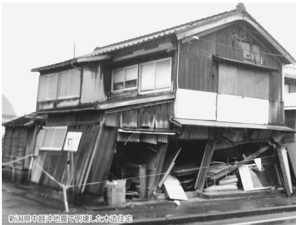
新潟県中越沖地震で倒壊した木造住宅

木造住宅の耐震診断を無料で行います 市では、安全で安心して暮らせる震災に強いまちづくりを推進するため、平成20年に安中市耐震改修促進計画を定め、木造住宅を対象として、無料で耐震診断者を派遣し、耐震診断を行い診断結果をお知らせします。