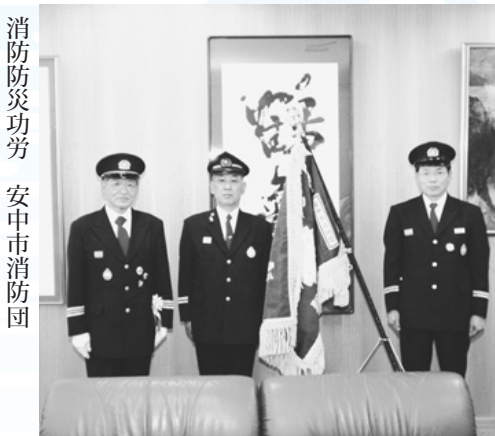
消防防災功勞 安中市消防団