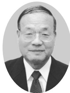
横山 登 議員