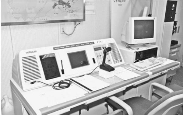
写真上：松井田支所内の防災行政無線操作卓 写真右：旧松井田町内に設置されている屋外子局