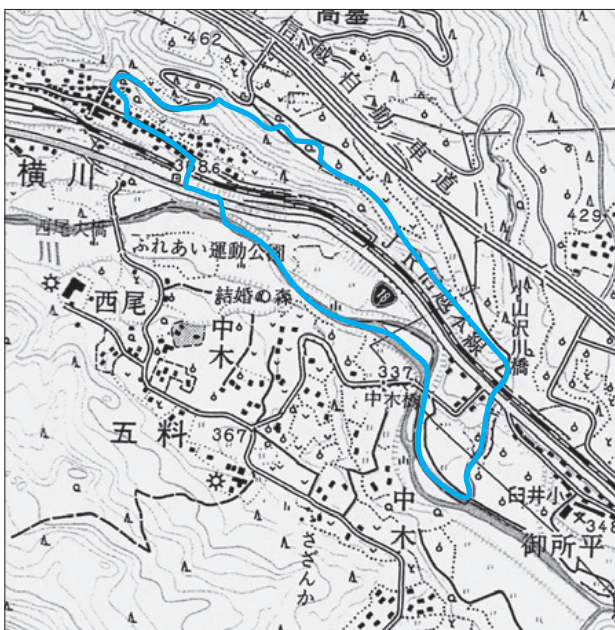
平成21年度地籍調査実施区域図 (○で囲まれた地域)