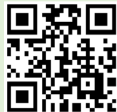
確定申告書等 作成コーナー