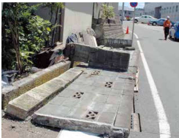
地震によるブロック塀の倒壊