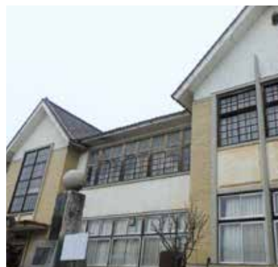
安中市資料館・外観

ので、市の歴史に興味がある人はぜひお越しください。 臨時開館について 📅2月15日(木)～29日(木) 🕒午前9時～午後5時(入館は午後4時30分まで) 📍安中市資料館(東上秋間1533) 💰無料 📞文化財課文化財活用係 (☎382-7622)