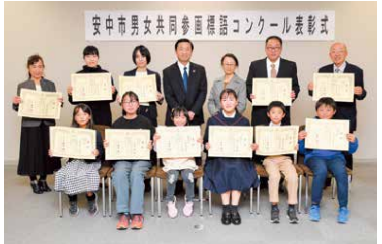
受賞者の皆さん、おめでとうございます