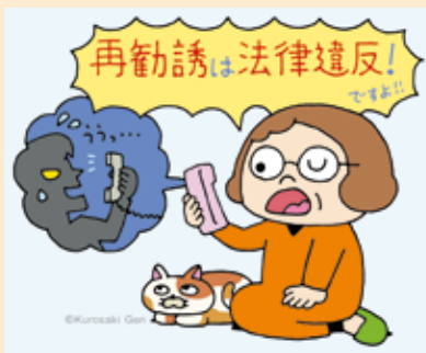
本文イラスト 黒崎 玄

①毎日のように「何にでも効く」という健康食品の勧誘電話がかかってくる。あまりにしつこいので購入を承諾してしまった。届いたサプリを飲んでみたが効果もないし、金額も約11万円と高額だ。年金生活で支払いも厳しく、解約したい。