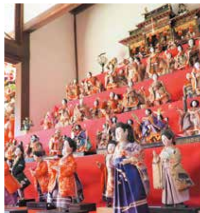
令和元年度の様子

📅2月15日(木)～3月10日(日) ※月曜休館 🕒午前9時～午後5時(入館は午後4時30分まで) 📍五料の茶屋本陣 お西・お東 💰大人210円・中学生以下100円、団体20人以上割引(大人150円・中学生以下70円) 📞文化財課文化財活用係 (☎382-7622)